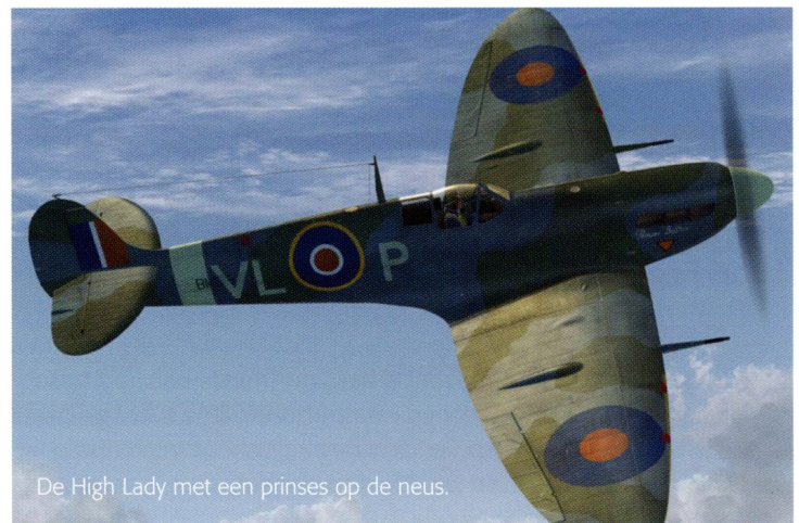
De High Lady met een prinses op de neus.

En wat gebeurt er eigenlijk met het Supermarine-wrak? Welnu: dat zal door de stichting voor een bescheiden bedrag van de verzekering worden teruggekocht en na het overzetten van het een en ander worden opgeslagen in een container. Vooralnog met de bedoeling het toestel met veel geduld stapje voor stapje te repareren. En weer luchtwaardig te krijgen. Inderdaad: een meerjarenplan. ✕